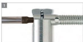
REGULACJA BOCZNA W SKRZYDLE