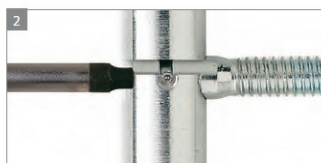
REGULACJA BOCZNA W OŚCIEŻNICY