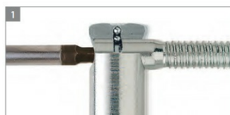
REGULACJA BOCZNA W SKRZYDLE

Zastosowana konstrukcja trzpieni umożliwia stabilne i pewne osadzenie zawiasu, a jego montaż ułatwiają specjalne, dedykowane przyrządy oraz zestawy montażowe dostępne na osobne zamówienie. Po zamocowaniu obu części zawiasu położenie osadzonego przy ich użyciu skrzydła można regulować w trzech płaszczyznach (poziomej / pionowej / głębokości). Regulacja wykonywana jest przy użyciu jednego klucza i nie wymaga demontażu skrzydła. Drzwi mogą być regulowane w trakcie użytkowania.