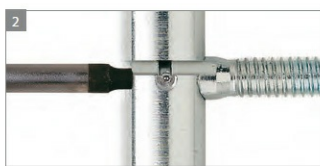
REGULACJA BOCZNA W OŚCIEŻNICY