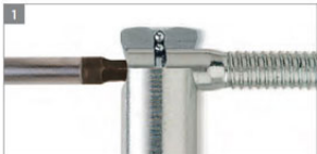
REGULACJA BOCZNA W SKRZYDLE