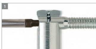
REGULACJA BOCZNA W SKRZYDLE

Po zamocowaniu obu części zawiasu, położenie osadzonego przy ich użyciu skrzydła można regulować w trzech płaszczyznach (poziomej / pionowej / głębokości) w taki sposób, jak prezentuje to rysunek. Regulacja wykonywana jest przy użyciu jednego klucza i nie wymaga demontażu skrzydła. Drzwi mogą być regulowane w trakcie użytkowania.