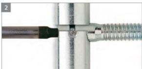
REGULACJA BOCZNA W OŚCIEŻNICY